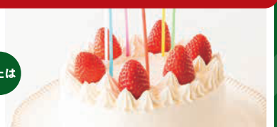
苺のショートケーキ(5号)