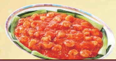
J 海老のチリソース 単品 4,000円(税込4,320円)