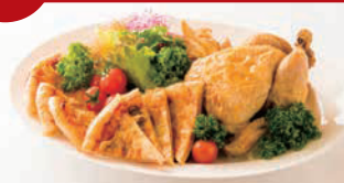
ローストチキン&オードブル