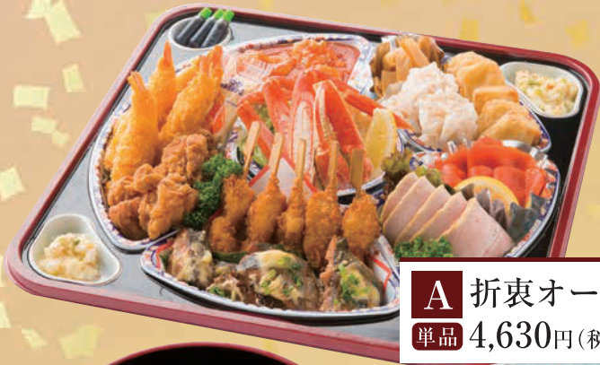
A 折衷オードブル「和」 単品 4,630円(税込5,000円)