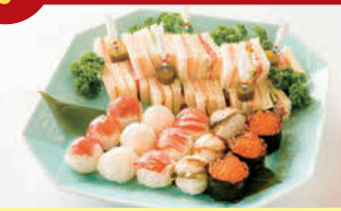
サンドウィッチ&手まり寿司