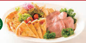
ローストビーフ & オードブル