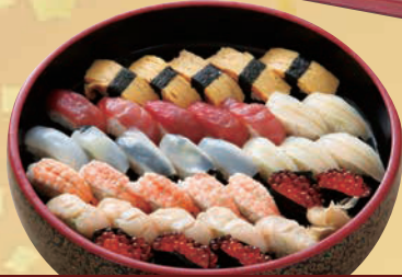
C 江戸前寿司「梅」 単品 4,630円(税込5,000円)