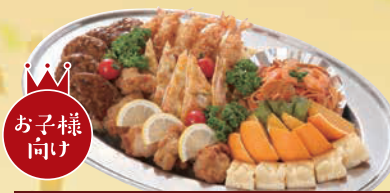
H お子様向けオードブル 単品 4,000円(税込4,320円)