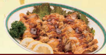
K 油淋鶏 単品 4,000円(税込4,320円)