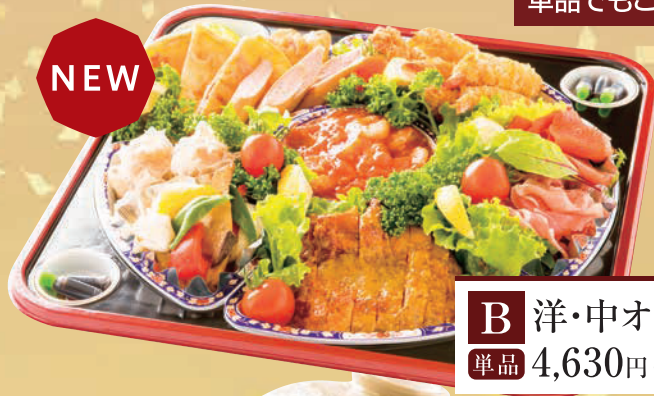
B 洋・中オードブル「彩」 単品 4,630円(税込5,000円)