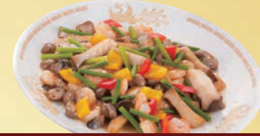
L 海老のXO醬炒め 単品 4,000円(税込4,320円)