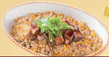
G サイコロステーキ&ピラフ 単品 4,000円(税込4,320円)