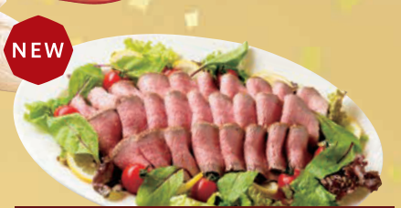
F ローストビーフ (モモ400g) 単品 4,000円(税込4,320円)