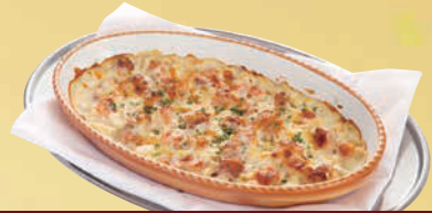
I シーフードグラタン 単品 4,000円(税込4,320円)