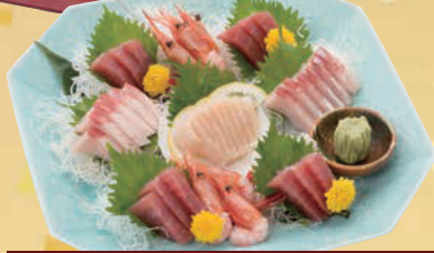
D 刺身盛り合せ 単品 4,000円(税込4,320円)