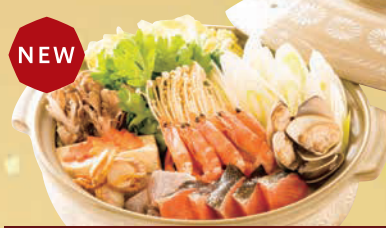
E 海鮮よせ鍋 ※加熱調理が必要となります 単品 4,000円(税込4,320円)